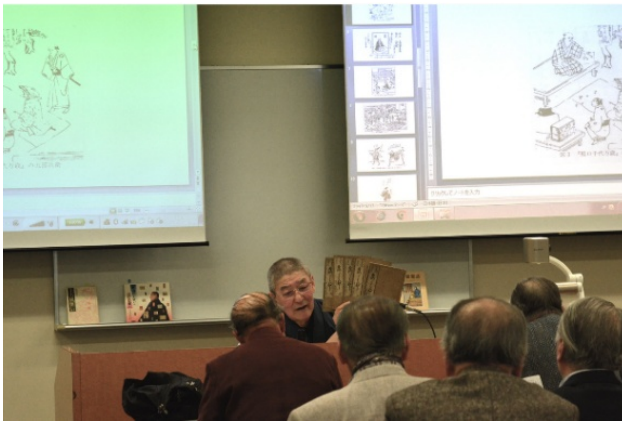
5冊揃えを持つのは肥田先生だけ