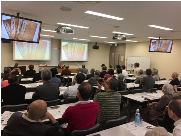
全体風景（後ろから）